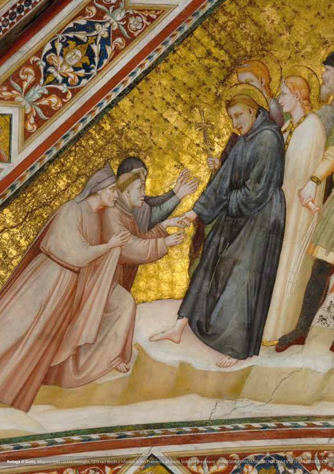
Bottega di Giotto, Allegoria della castità (dettaglio; 1315 ca.); Basilica inferiore di San Francesco ad Assisi, Volta del Presbiterio